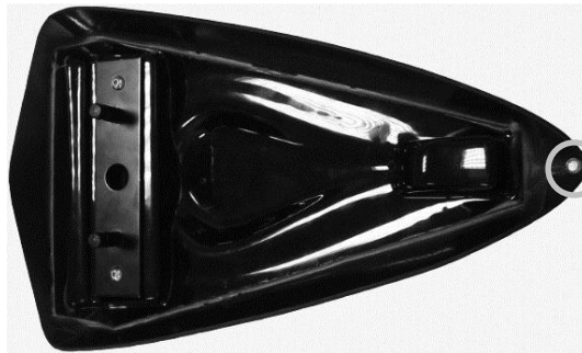
Position de la butée caoutchouc

Positionnez la patte de fixation comme indiqué sur la photo.