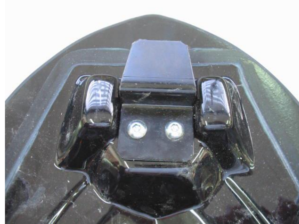
Position de la patte arrière du capot de selle