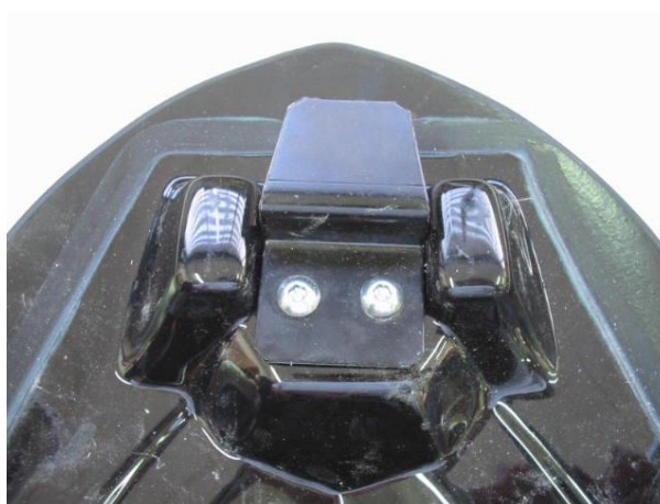
Location of rear bracket