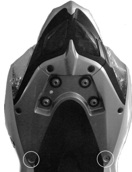
Position des agrafes filetées