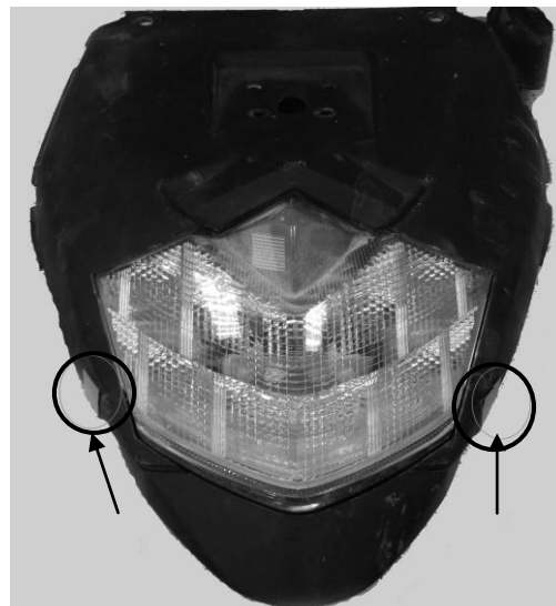
Position des morceaux de scotch double face