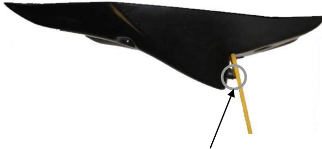
Beveled spacers position

ERMAX PLATE HOLDER ADAPTABLE ON Z 1000 2003/2006 Z 750 2004/2006