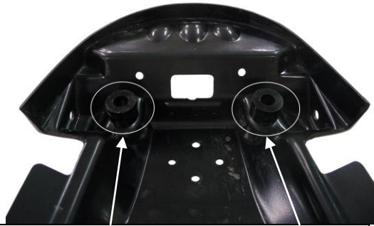
Position des entretoises Ø10 L : 5mm + L : 10mm