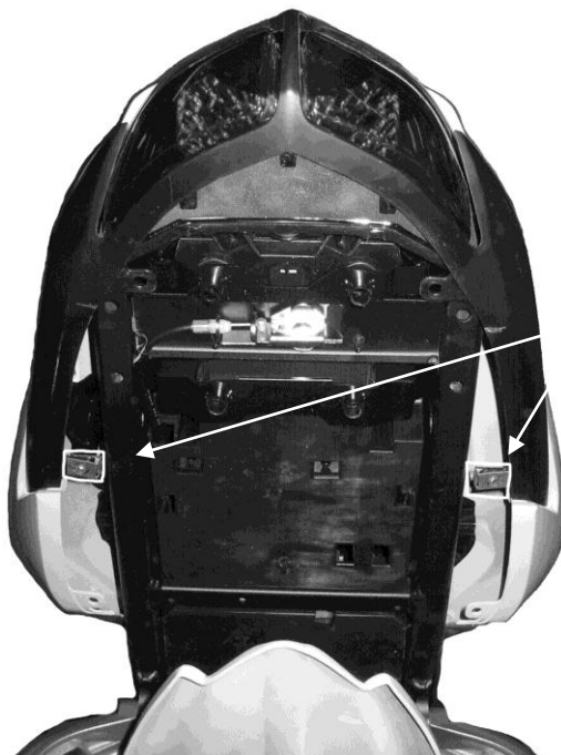
Position des agrafes filetées

PASSAGE DE ROUE ERMAX ADAPTABLE SUR FZ1 2006 → ∞ Pneu d'origine : Dunlop D221 190/50 ZR17