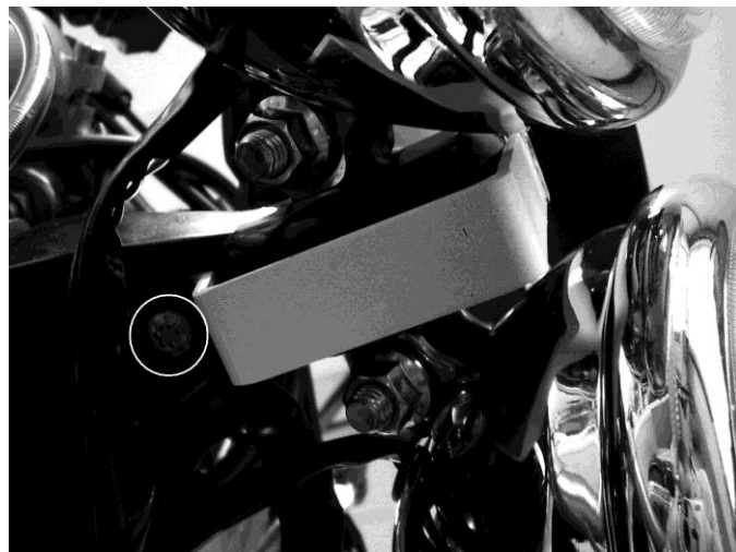
Location of bracket's fitting screw