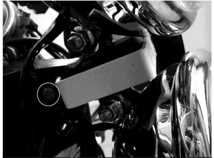
Position de la vis de fixation de la patte