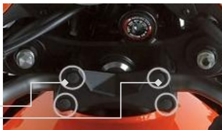
Photo 2 Vis à démonter et à remplacer