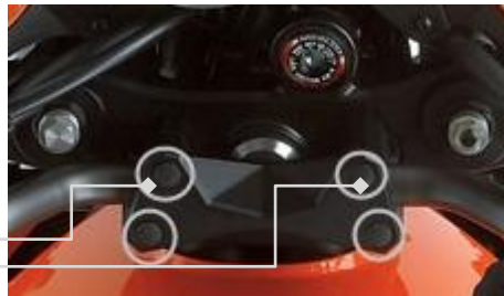
Photo 2 Screws to remove and replace