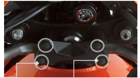
Photo 2 Screws to remove and replace