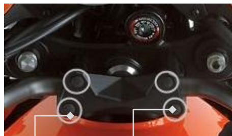
Photo 2 Vis à démonter et à remplacer