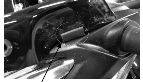
Position des morceaux de joint caoutchouc