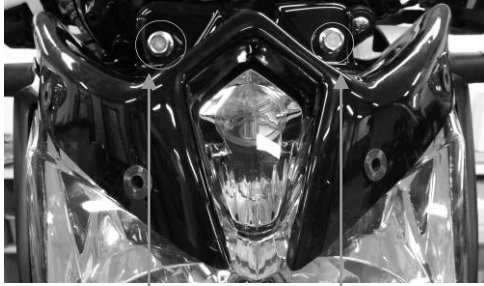
Vis de maintien du phare et du support bulle