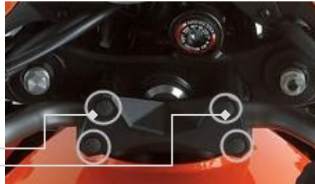
Photo 2 Screws to remove and replace